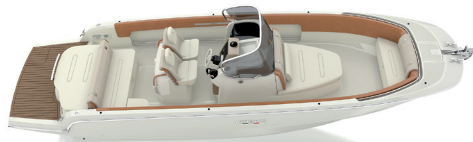
Configurazione "Leisure" compatta / Compact "Leisure" configuration