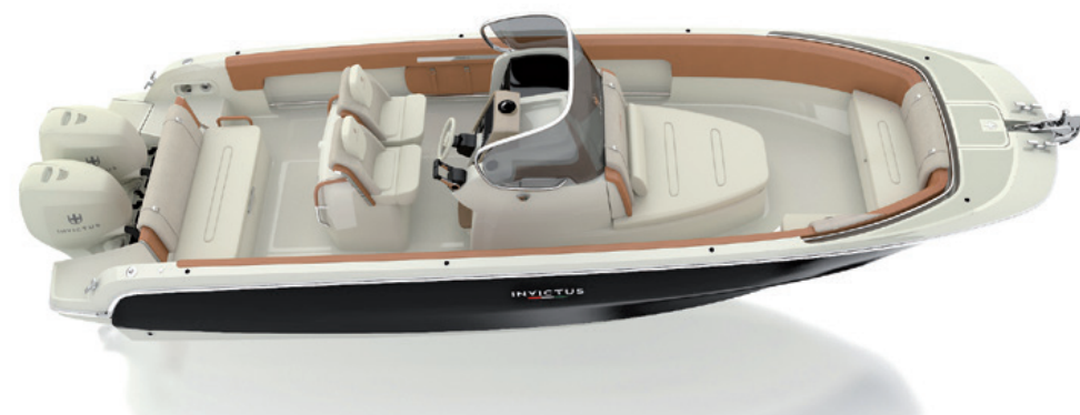
Configurazione "Leisure" compatta / Compact "Leisure" configuration