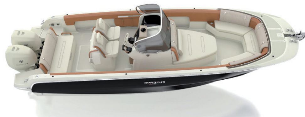
Configurazione "Leisure" estesa / Extended "Leisure" configuration